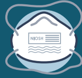
እንደሚገጥም የተመረመረ N95 መተንፈሻ