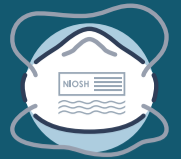
እንደሚገጥም የተመረመረ N95 መተንፈሻ

*የሚፈለገው የግል መከላከያ መሣሪያ በሚፈለገው የመገለጫ ጥንቃቄ ላይ ተመስርቶ ይለያያል። የግል መከላከያ መሣሪያውን እና የደረጃዎች ቅደም ተከተል የጥንቃቄ ደረጃን ለማስማማት ይለውጡ።